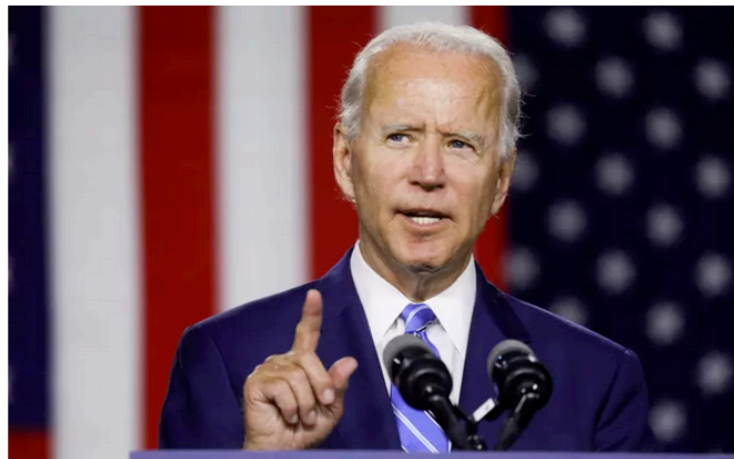
Ook op de account van de Amerikaanse presidentskandidaat Joe Biden werd door hackers om bitcoin gevraagd.

Ook de account van Geert Wilders lijkt woensdagnacht te zijn overgenomen. Zijn profielfoto is vervangen door een karikatuur van een zwarte man. De personen achter de hack retweeten complottheorieën vanaf Wilders' account. Op diens pagina is nog niet om geld gevraagd. Het is niet duidelijk of de kaping van Wilders' profiel verband houdt met de bitcoinhack. Tot de slachtoffers behoren ook miljardair Mike Bloomberg, rapper Kanye West en diens vrouw Kim Kardashian.