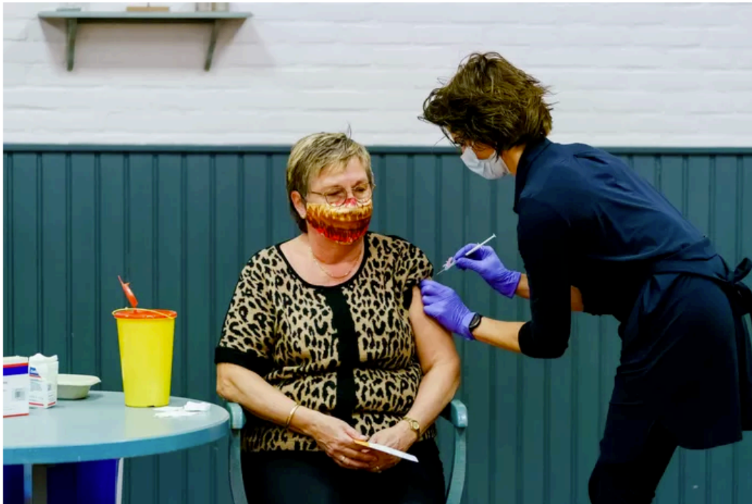
▲ In Nederland begonnen het vaccineren met de AstraZenecaprik door huisartsen in het Zeeuwse Bruinisse.

Zuid-Afrika stopte al eerder met het inenten met AstraZeneca, maar dat was omdat het vaccin niet goed werkte tegen de Zuid-Afrikaanse variant van het coronavirus.